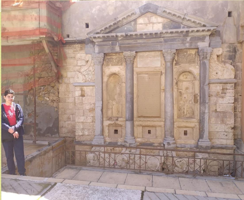
ΕΝΕΤΙΚΗ ΚΡΙΝΗ ΠΡΙΟΥΛΗ