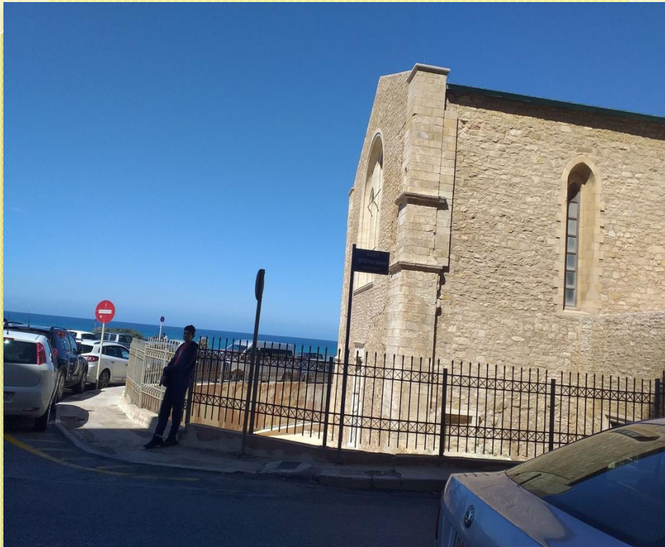
ΜΟΝΗ ΑΓΙΟΥ ΠΕΤΡΟΥ ΚΑΙ ΠΑΥΛΟΥ