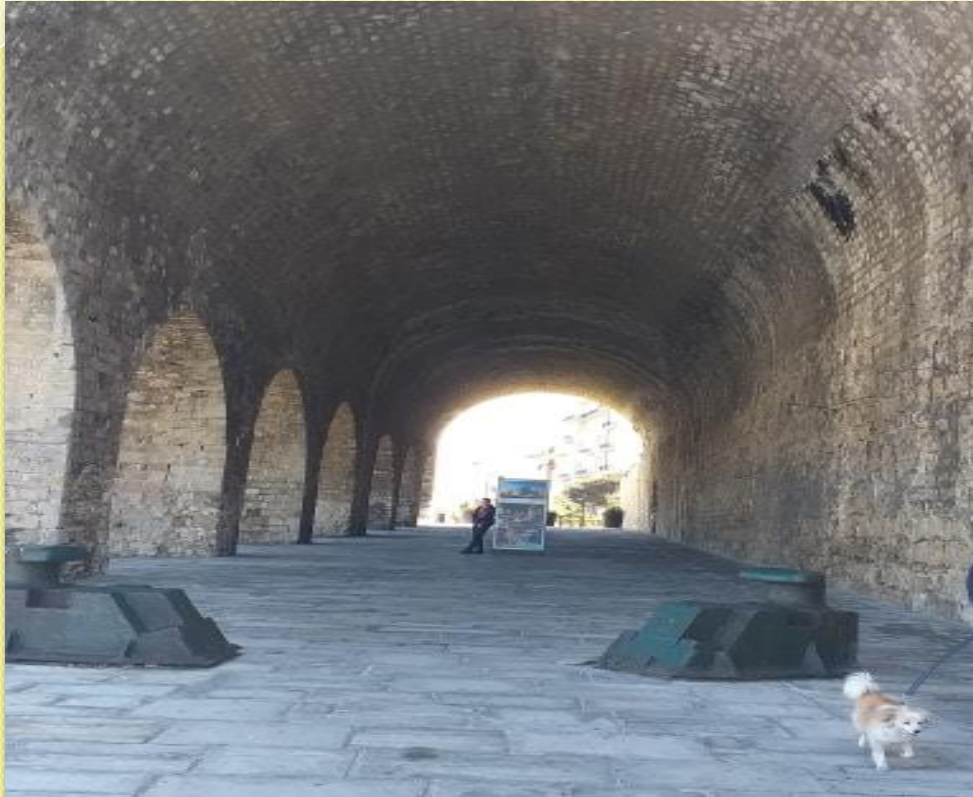
ΕΝΕΤΙΚΑ ΝΕΟΡΙΑ ΤΕΙΧΗ