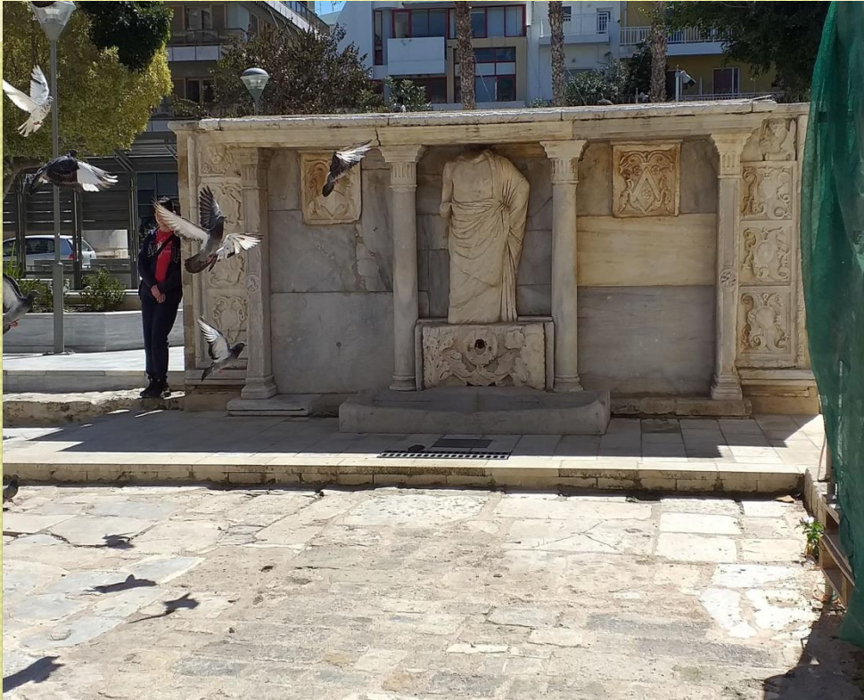
ΕΝΕΤΙΚΗ ΚΡΗΝΗ ΒΕΜΒΟ