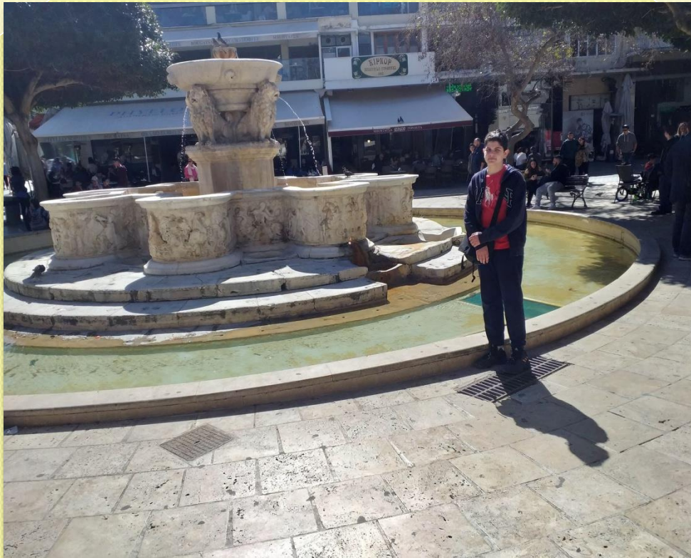
ΕΝΕΤΙΚΗ ΚΡΗΝΗ ΜΟΡΟΖΙΝΗ (ΛΙΟΝΤΑΡΙΑ)