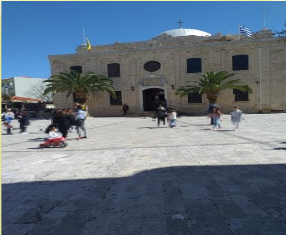
ΝΑΟΣ ΤΟΥ ΑΓΙΟΥ ΤΙΤΟΥ