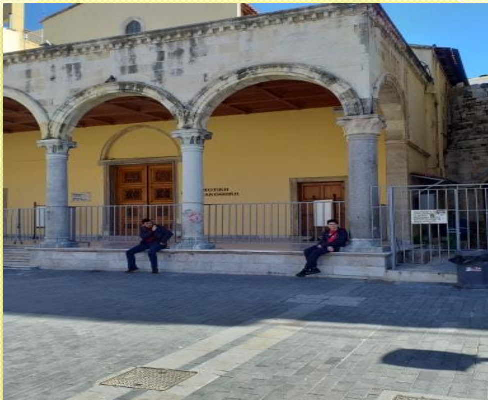
ΒΑΣΙΛΙΚΗ ΤΟΥ ΑΓΙΟΥ ΜΑΡΚΟΥ