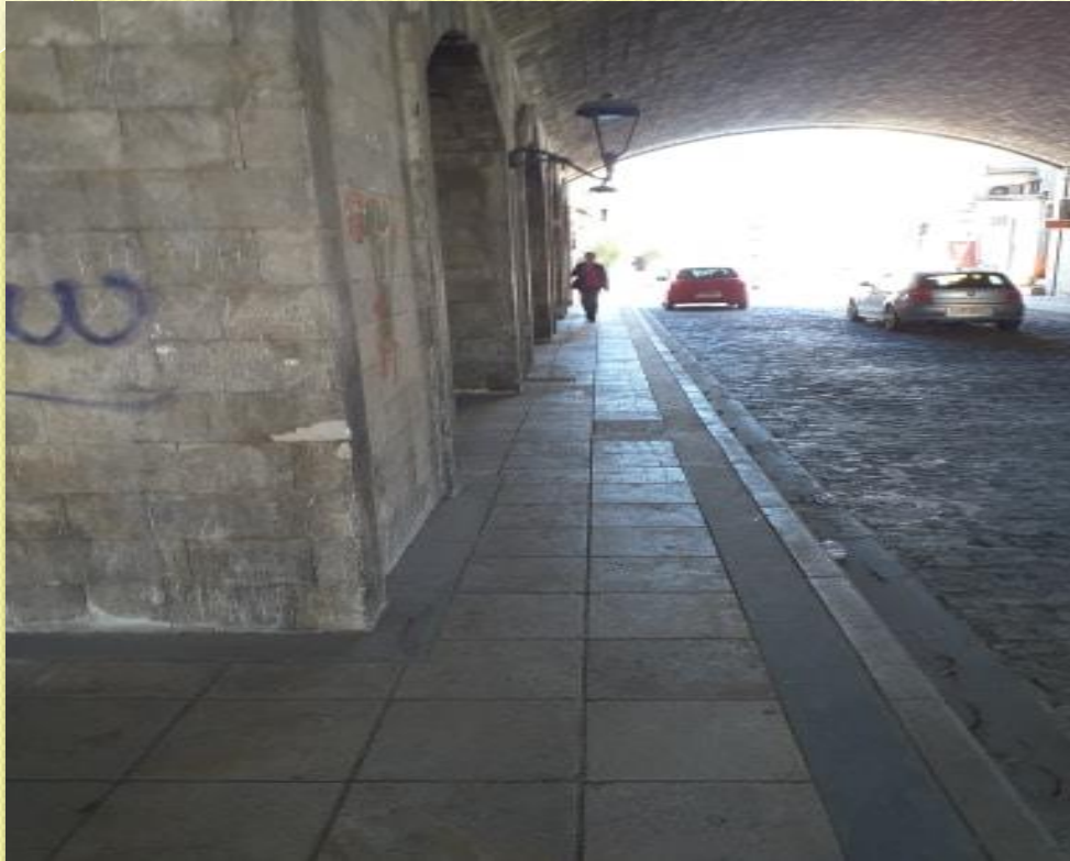
ΕΝΕΤΙΚΗ ΠΥΛΗ ΙΗΣΟΥ