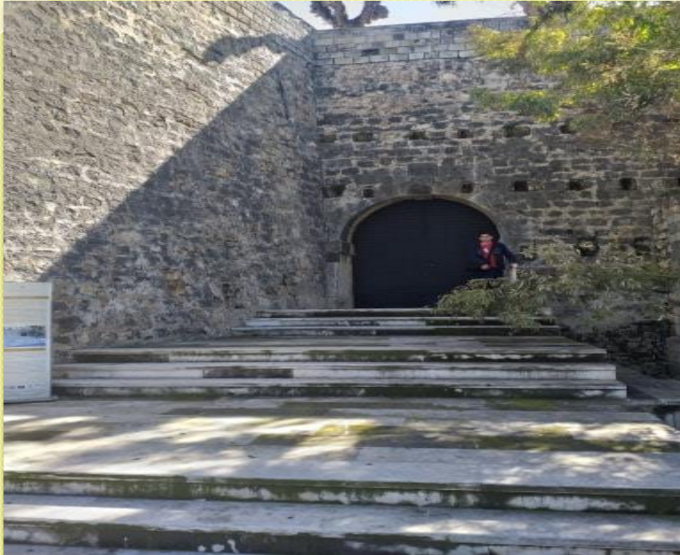
ΕΝΕΤΙΚΗ ΠΥΛΗ ΑΓΙΟΥ ΓΕΩΡΓΙΟΥ