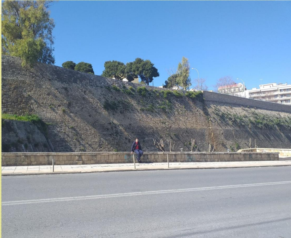
ΕΝΕΤΙΚΑ ΤΕΙΧΗ ΗΡΑΚΛΕΙΟΥ