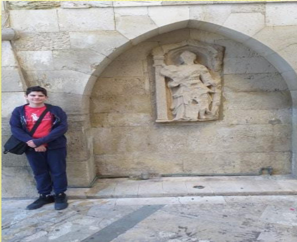
ΕΝΕΤΙΚΗ ΚΡΙΝΗ SAGREDO