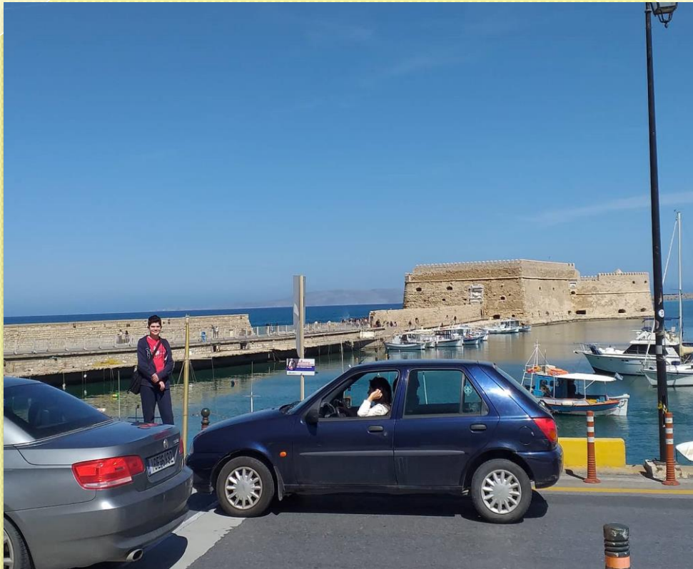
ΕΝΕΤΙΚΟ ΦΡΟΥΡΕΙΟ ΚΟΥΛΕΣ