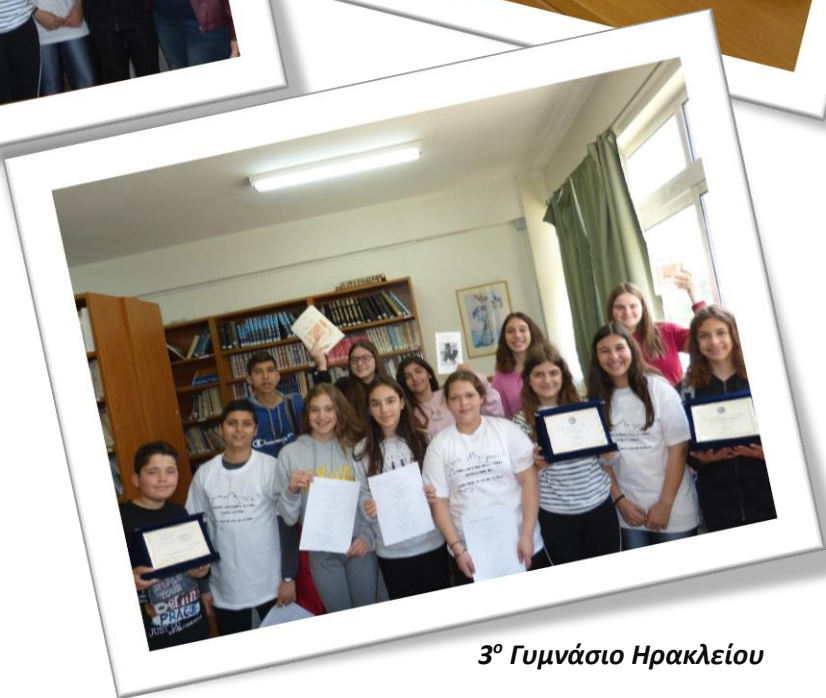
3 ο Γυμνάσιο Ηρακλείου